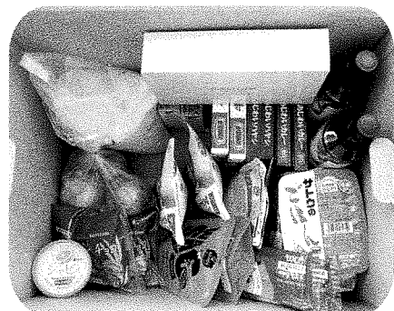
▲お渡しした子ども用サンダルや食料品