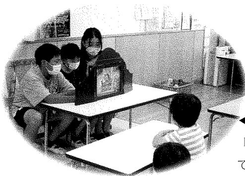
◀ 8月4日 「空の杜保育園での読み聞かせ」

8月11日山の日に、『夏休み子ども応援プロジェクト』として、ひとり親世帯のうち児童扶養手当を受給している世帯や、就学援助を受けている世帯、18歳以下の子どもが4人以上いる世帯のいづれかに該当する方を対象に、食糧品などの支援を行うフードパントリー事業を実施しました。今回の申込者数は、75世帯283名。町内外の企業や各種団体、市民の皆さまからご寄付いただいた食品や日用品の配布に加え、埼玉県社会福祉協議会の衣類