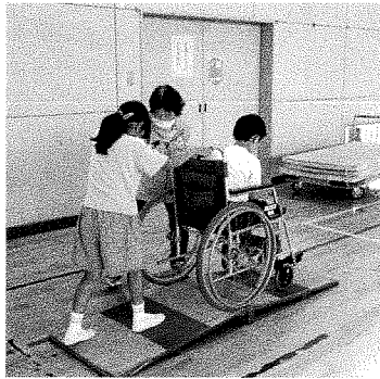
▲福祉体験学習(車椅子体験)

社会福祉協議会では、年4 回町民の皆様、区長会等のご 協力により各種会費募集・募 金を実施しています。 なお、令和5年度の日赤活動 資金募集、社協会員会費の実 績額は次のとおりです。 ご協力大変ありがとうございました。